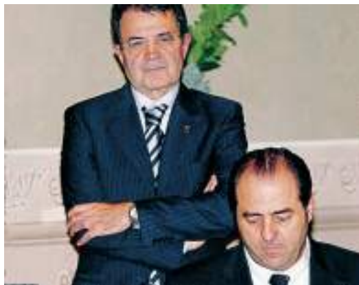
Romano Prodi in piedi e Antonio Di Pietro

Di Pietro chiede che la questione venga affrontata in Consiglio dei ministri. La notizia del suo intervento arriva dal suo sito personale (www.antoniodipietro.it). Scrive nel suo messaggio l'ex pm