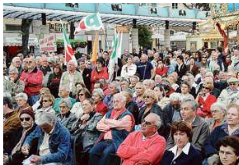
Il popolo del Pd in un recente comizio in piazza Sisto IV a Savona