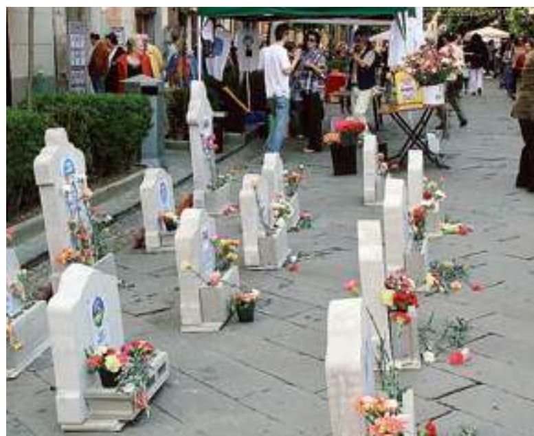
Il "cimitero dei partiti" dei grillini