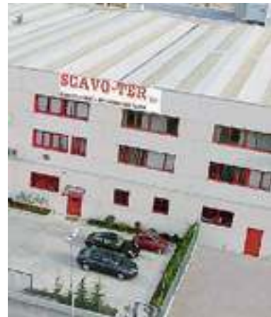
La sede della Scavo-ter a Savona