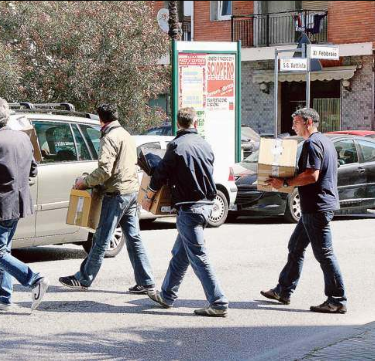
I finanzieri escono dal Comune di Vado con la documentazione sequestrata