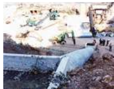
La cava Fazzari