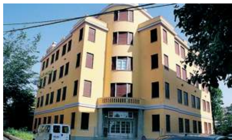
Uno dei padiglioni dell'ex ospedale psichiatrico di Quarto

«Non siamo immobiliari - precisa - e ci piace lavorare in maniera concertata con gli enti». Il gruppo lavora già alla Ghigliazza, per la riquali-