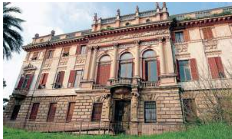
Villa Raggio, sede dell'ex Istituto ortopedico San Giorgio, in via Pisa

ficazione dell'ex cava, ma ha cantieri aperti anche alla Spezia (porto turistico di Mirabello) e a Genova (ex Fonderie San Giorgio di Pra).