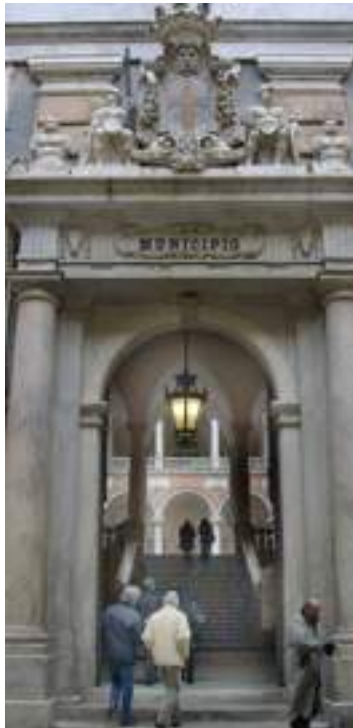
Tursi taglia nelle partecipate