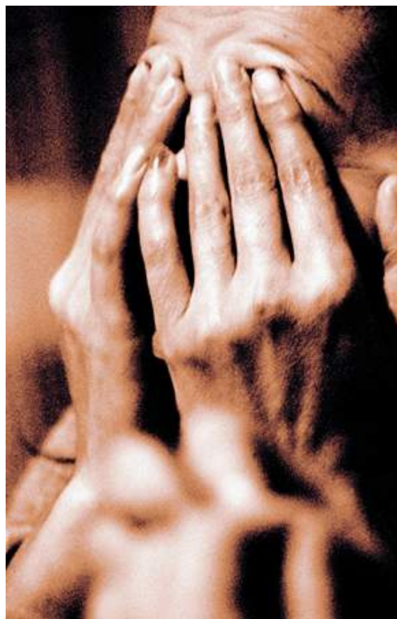
SABATO alle 18 alla biblioteca Berio di Genova si inaugura la mostra fotografica "Prigioniere" di Susanna Perachino, immagini in bianco e nero che raccontano storie di donne vittime di violenze domestiche.