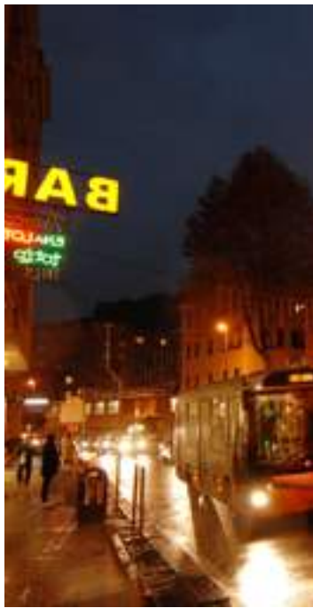
Molassana ieri sera