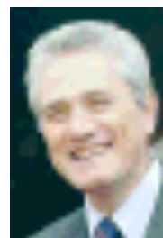
Il ministro Francesco Rutelli