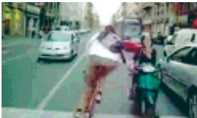
Uno dei "corridori" in gara, contromano in mezzo al traffico

Il servizio partirà dalla cerchia e dalle zone universitarie