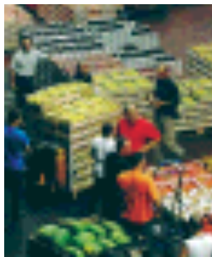
ORTOMERCATO A maggio la squadra mobile arrestò i boss tra i bancali di frutta e verdura

Se la Calabria resta il ventre molle della 'ndrangheta, Milano è diventato il centro strategico e il cuore dei suoi affari. Lo racconta l'ultimo rapporto della commissione parlamentare antimafia. In città e nelle periferie dominano le cosche della Locride — tristemen-