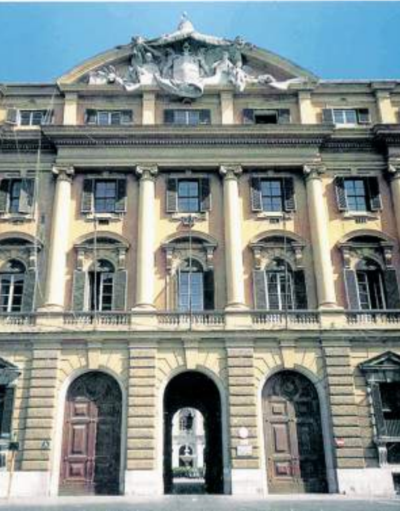
La facciata del ministero delle Finanze nel quartiere romano di Trastevere

Noi abbiamo pubblicato soltanto atti ufficiali della Gpsc. La società vuole smentire se stessa? (M. MEN. EF. SA.)