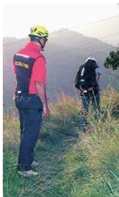
Soccorso alpino in azione