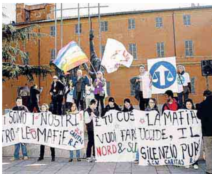
La manifestazione anti-mafia a Reggio del primo marzo

Infine, pure il gruppo consigliere Pd di Reggio Emilia aderisce al presidio contro le mafie e per la legalità. Nella